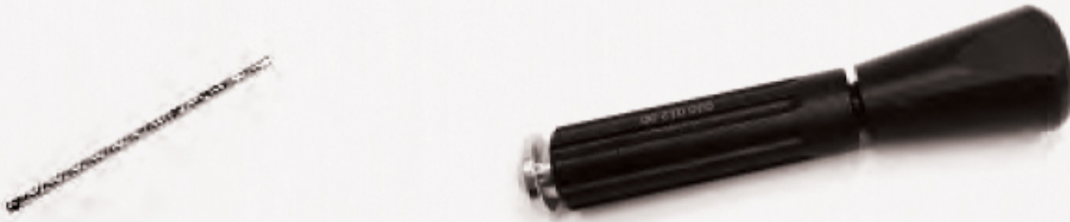
Vástago atornillador 2,0 mm