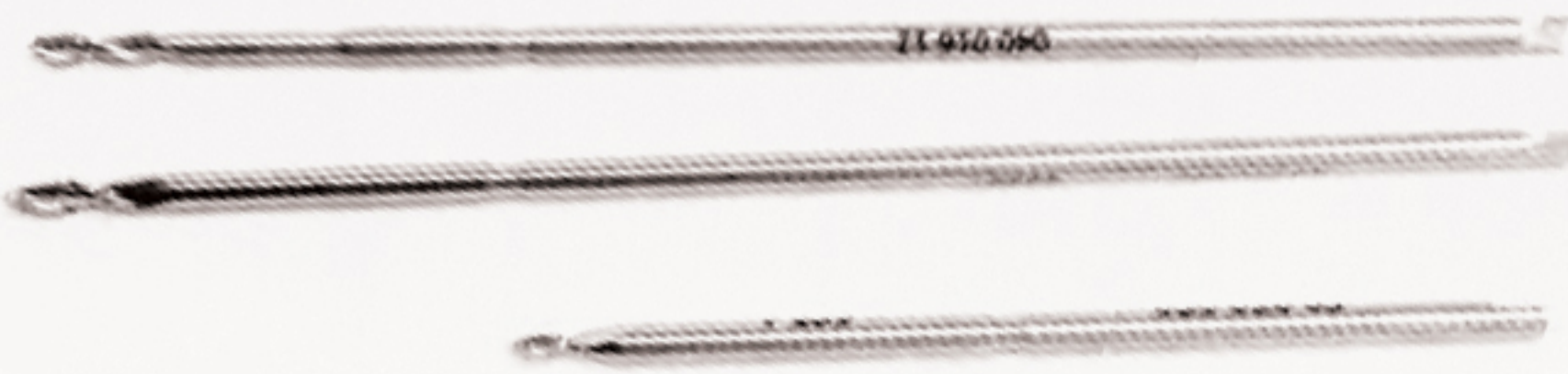
Mecha de 1.5 mm Tope en 5 mm Mecha diam 2.2 c/tope 20 / Mecha diam 2.0 c/tope 20